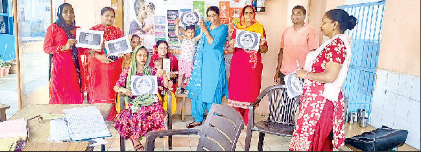
झज्जर। टीकाकरण अभियान के दौरान लोगों को जागरूक करते हुए स्वास्थ्य कर्मी।

स्वास्थ्य विभाग एवं राष्ट्रीय स्वास्थ्य मिशन, हरियाणा के संयुक्त तत्वाधान में जिले में विशेष टीकाकरण अभियान चलाया जा रहा है। इस अभियान का उद्देश्य पांच वर्ष तक की आयु के उन बच्चों को आवश्यक टीके लगवाना, जो किसी कारणवश नियमित टीकाकरण से वंचित रह गए हैं। आगामी 28 जून तक जिलेभर में विशेष टीकाकरण अभियान चलाया जा रहा है। इससे जानलेवा व गंभीर बीमारियों जैसे कि गलघोंटू, टेटनस, निमोनिया, तपेदिक, टीबी, काला पीलिया, दस्त,