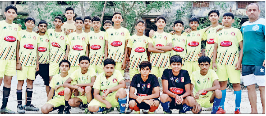
बहादुरगढ़। इस पहल में भापड़ोदा के खिलाड़ी।

हरिभूमि न्यूज़ | झज्जर मुक्ति की शपथ दिलाई गई। कार्यक्रम का मुख्य उद्देश्य विद्यार्थियों को नशा करने से होने वाले नुकसान और मादक पदार्थों के सेवन के दुष्प्रभावों से अवगत कराया गया। इस दौरान विद्यार्थियों को किसी भी प्रकार का नशा न करने की शपथ दिलाई गई। कार्यक्रम का मुख्य उद्देश्य विद्यार्थियों को नशा करने से होने वाले नुकसान और मादक पदार्थों के सेवन के दुष्प्रभावों से अवगत कराया गया। इस दौरान विद्यार्थियों को किसी भी प्रकार का नशा न करने की शपथ दिलाई गई।