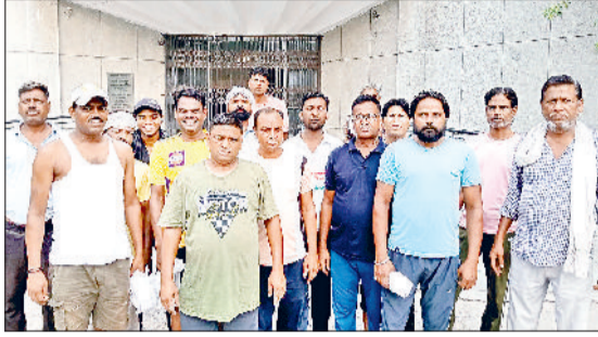
झंझार। पुराने नगर पालिका भवन में एकत्रित कूड़ा उठाने वाले कर्मचारी व अंबेडकर चौक पर सफाई कर्मचारियों द्वारा किया जा रहा कूड़ा उठान।

इसी संबंध में वे पहले तीन दिनों तक हड़ताल कर भी कर चुके हैं, लेकिन नगर परिषद अधिकारियों के कहने व ठेकेदार द्वारा सप्ताह भीतर बकाया वेतन उनके खातों में डालने के आश्वासन पर वे फिर से काम पर