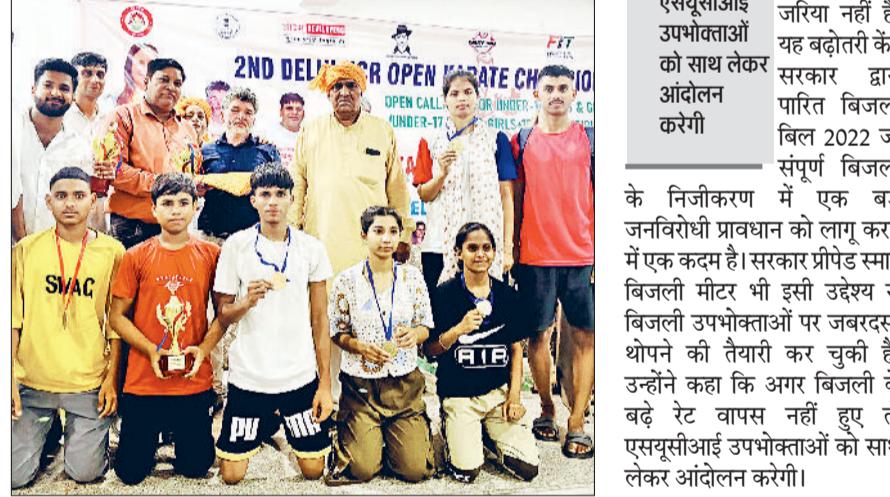
बहादुरगढ़। अतिथि व आयोजकों के साथ पदक विजेता कराटे खिलाड़ी।