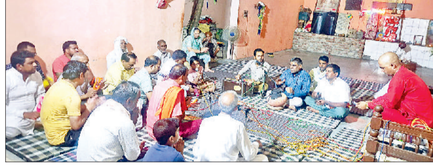
झज्जर। हनुमान चालीसा पाठ के दौरान उपस्थित श्रद्धालु।