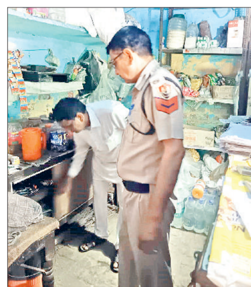
झंझार। ऑपरेशन आक्रमण के दौरान तलाशी लेते हुए पुलिसकर्मी।

के दौरान जिले के अलग अलग संभावित स्थानों पर संदिग्ध व्यक्तियों की जांच की गई। जांच के दौरान दो आरोपियों को नशीले पदार्थ गांजा व स्मैक सहित पकड़ा गया। पकड़े गए आरोपी से 87 ग्राम गांजा व 9.28 ग्राम स्मैक बरामद हुआ। जबकि पांच अवैध हथियार और 28 जिंदा कारतूसों सहित भी एक आरोपी को गिरफ्तार किया गया। इसके अलावा तीन पीओ, 33 बेल जंपर व अन्य मामलों में 10 आरोपियों को गिरफ्तार किया गया। उन्होंने बताया कि अभियान के दौरान यातायात नियमों का पालन ना करने पर 122 वाहनों के चालान भी किए गए। जिनमें से ट्रिपल राइटिंग पांच, बिना हेलमेट दो, ब्लैक फिल्म लगे एक, लाल नीली बत्ती लगे आठ वाहनों, गलत दिशा में वाहन चलाने पर 18 और अन्य 45 वाहन चालकों सहित कुल 122 चालकों के चालान किए गए।