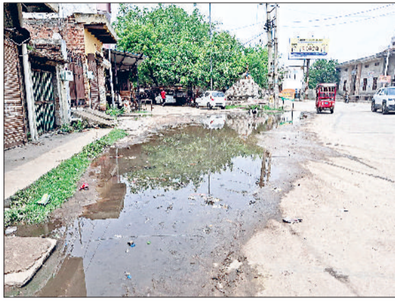
झज्जर। शहर के सीताराम गेट क्षेत्र में हुआ जलभराव।

हल्की बारिश ने खोली जलनिकासी के दावों की पोल सोमवार सांय हल्की बरसात ने ही जल निकासी के दावों की पोल खोल कर रख दी। सीताराम गेट में नालों की सफाई अच्छे तरीके से नहीं होने के कारण जलभराव हो गया। वहीं मेन बाजार में अंबेडकर चौक से नेता जी सुभाष चंद्र चौक तक अंडर ग्राउंड नालियों की सफाई नहीं होने के कारण दुकानों के बाहर हुए जलभराव कारण दुकानदारों और आमजन को कार्पा परेशानियों का सामना करना पड़ा। दुकानदार स्वयं पानी निकालते हुए दिखाई दिए।