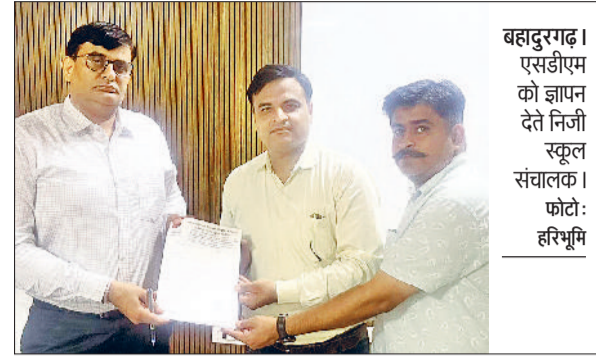
बहादुरगढ़। एसडीएम को ज्ञापन देते निजी स्कूल संचालक।

गाड़ियां नहीं निकाली। वे नप अधिकारियों व ठेकेदार के आने का इंतजार करते रहे। जब दोपहर करीब बारह बजे तक कोई अधिकारी जब उनकी सुध लेने नहीं पहुंचा तो वे निराश होकर अपने-अपने घरों को लौट गए।