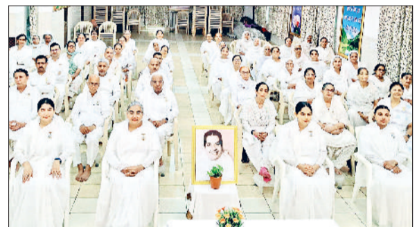
बहादुरगढ़। कार्यक्रम में मौजूद बीके अनुयायी।

केवल जनता द्वारा टैक्स के रूप में दिए जा रहे धन को संबंधित लोग अपनी जेबों में भरने का काम कर रहे हैं। देवीलाल पार्क, शहीद राव तुलाराम पार्क, किला मोहल्ला स्थित लक्ष्मणदास म्युनिसिपल पार्क, भगत सिंह पार्क सहित विभिन्न पार्कों की हालत दयनीय है।