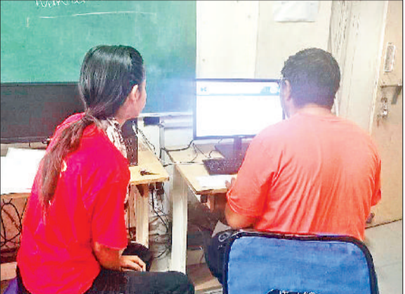
झज्जर। आईटीआई एट गुड्डा में स्थापित हेल्प डेस्क पर जानकारी लेते हुए विद्यार्थी।