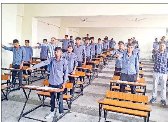
झज्जर। कार्यक्रम के दौरान शपथ लेते हुए विद्यार्थी।

हरिभूमि न्यूज़ | झज्जर मुक्ति की शपथ दिलाई गई। कार्यक्रम का मुख्य उद्देश्य विद्यार्थियों को नशा करने से होने वाले नुकसान और मादक पदार्थों के सेवन के दुष्प्रभावों से अवगत कराया गया। इस दौरान विद्यार्थियों को किसी भी प्रकार का नशा न करने की शपथ दिलाई गई। कार्यक्रम का मुख्य उद्देश्य विद्यार्थियों को नशा करने से होने वाले नुकसान और मादक पदार्थों के सेवन के दुष्प्रभावों से अवगत कराया गया। इस दौरान विद्यार्थियों को किसी भी प्रकार का नशा न करने की शपथ दिलाई गई।