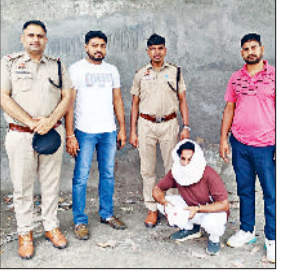
बहादुरगढ़। पुलिस की गिरफ्त में आरोपी।

करना महत्वपूर्ण है। रोड पर दर्शाई गई स्पीड के अनुसार ही वाहन चलाना चाहिए। दोपहिया वाहन को बिना हेलमेट के नहीं चलाना चाहिए। यातायात नियमों का पालन करना चाहिए। बहते पानी वाले स्थान पर गाड़ी धीमी गति में चलाना चाहिए। अज्ञानता से पानी सड़क पर जमा हो जाता है। जिस कारण वाहन चालकों को सड़क पर उपस्थित गड्ढे दिखाई नहीं देते हैं। इससे बचने के लिए लोगों को चाहिए कि वे बारिश के मौसम में यातायात पुलिस द्वारा निर्धारित मानक रूट पर चलें। पुलिस प्रशासन सड़क दुर्घटनाओं को रोकने और नागरिकों की सुरक्षा सुनिश्चित करने के लिए पूरी तरह सतर्क तथा प्रतिबद्ध है। आमजन भी जागरूकता दिखाएं।