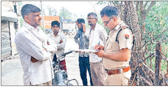
झंझार। गण्णा गोदाम मालिक से मामले की जानकारी लेते हुए पुलिसकर्मी।