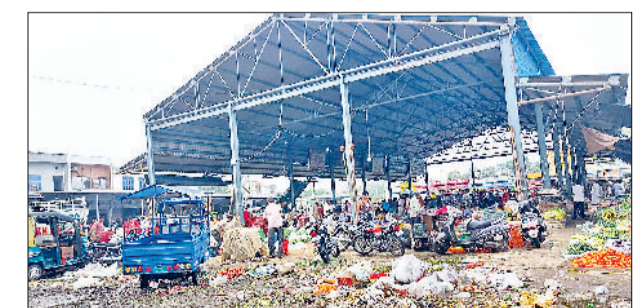
झंझार। सब्जी मंडी में फैला कीचड़ व कूड़ा।

अलसुबह से आसमान में छाए बादलों से लोगों को बरसात होने की उम्मीद जगी थी, लेकिन शाम तक बारिश नहीं होने के कारण लोगों के